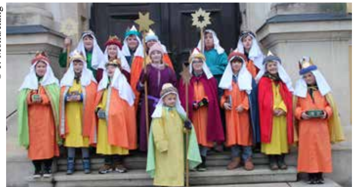
Am 3. Jänner waren 11 Sternsingergruppen, am 4. Jänner 7 Sternsingergruppen unterwegs