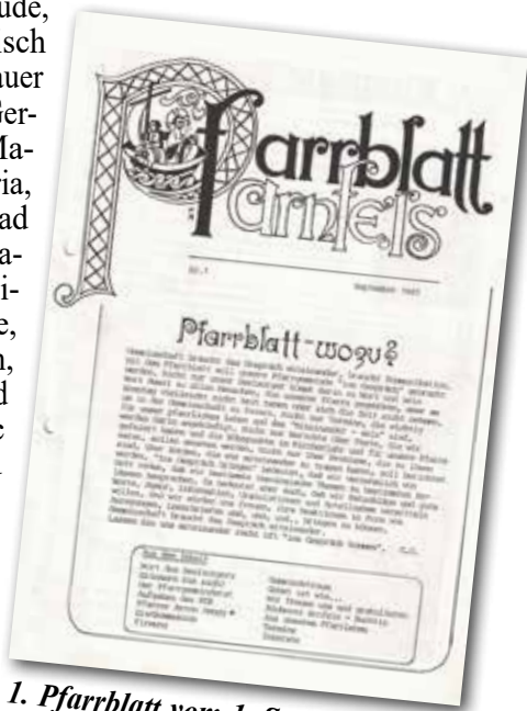
1. Pfarrblatt vom 1. Sept. 1987