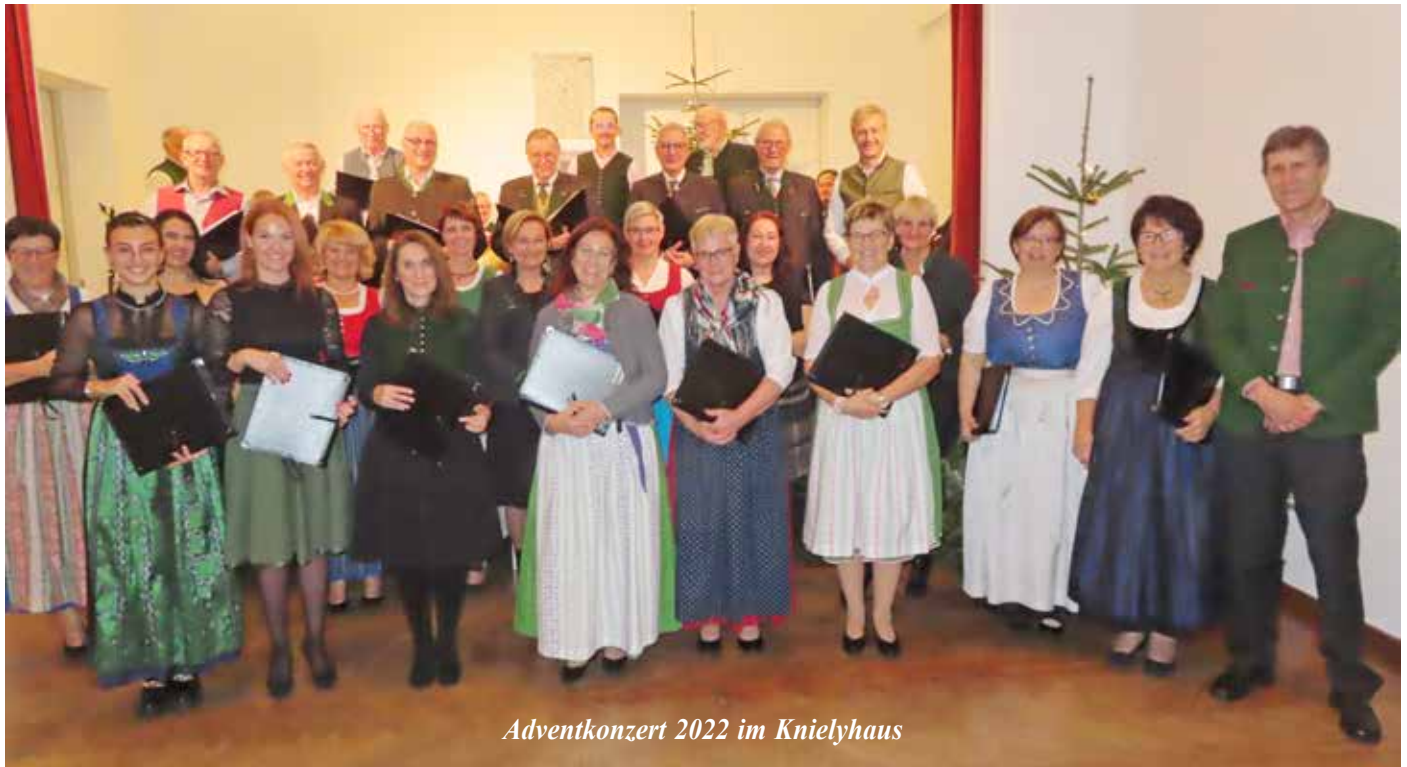
Adventkonzert 2022 im Knielyhaus